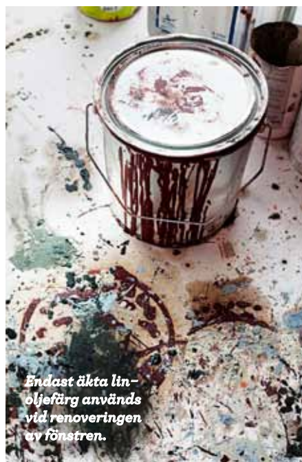
Endast äkta linoljaefärg används vid renoveringen av fönstren.

– När vi besiktigade husen upptäckte vi att fönstren var väldigt slitna genom sitt utsatta läge, speciellt på västsidan mot Riddarfjärden. Vi bestämde oss för att ha en hög ambitionsnivå och göra ett grundligt renoveringsarbete med fönstren. Det är ett tidsödande hantverk med gamla metoder och naturmaterial som