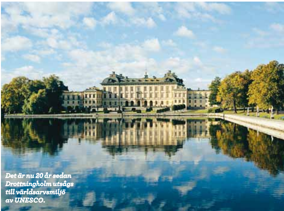
Det är nu 20 år sedan Drottningholm utsågs till världsarvsmiljö av UNESCO.

Av alla konventioner är världsarvskonventionen den som flest länder skrivit under och de förbinder sig därmed att bevara och vårda, öka och sprida kunskap om de egna natur- och kulturmiljöer som är världsarv.