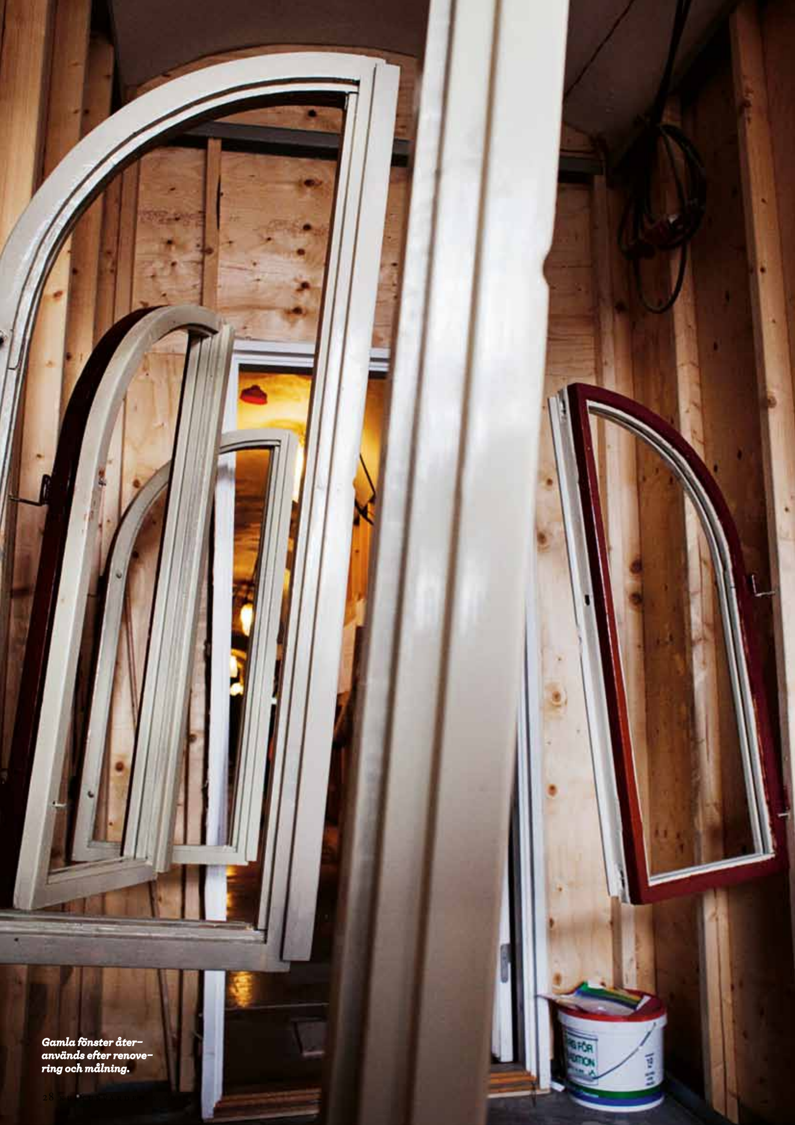
Gamla fönster åter- används efter renove- ring och målning.