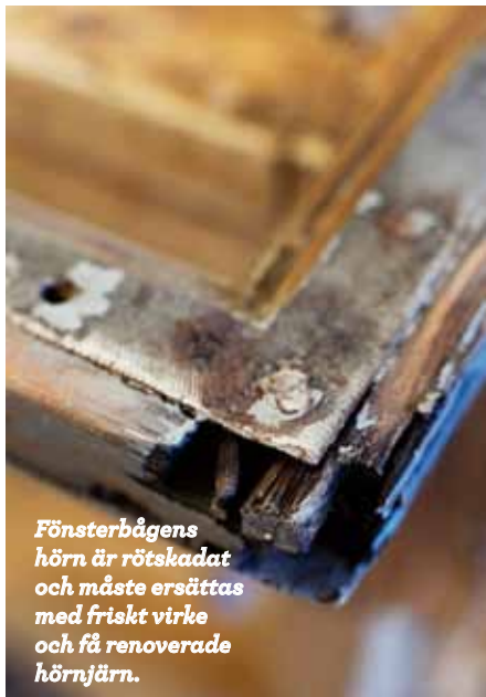
Fönsterbågens hörn är rötskadat och måste ersättas med friskt virke och få renoverade hörnjärn.

Det har omkring 250 fönster i huset. Med åtta båggar i varje blir det sammanlagt 2 000 båggar som ska renoveras